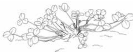
Schéma de Pastor, trèfle violet spécial Pâturage

62, rue Léon Beauchamp - B.P. 18 59932 La Chapelle d'Armentières Cedex Tel : +33 (0)3 20 48 41 41 - Fax : +33 (0)3 20 48 41 30 Email: contact@semences-de-france.fr